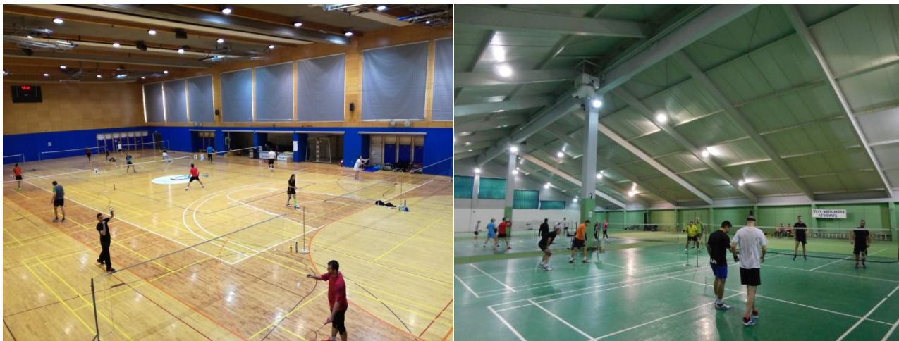
Turnirja Trump lige