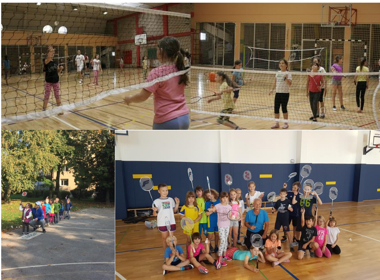
Fotografije s projektov Slovenija igra badminton