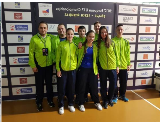
EP do 17 let – Praga, november 2017