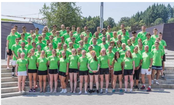
BEC Summer School – Podčetrtek, julij 2017