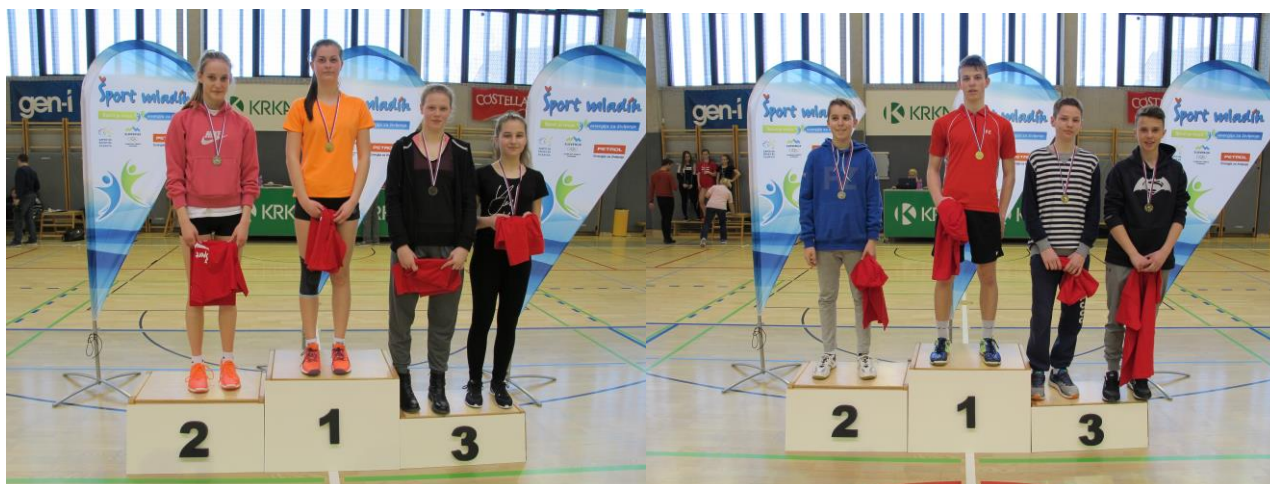
Zgoraj DP srednje šole, spodaj DP osnovne šole posamično